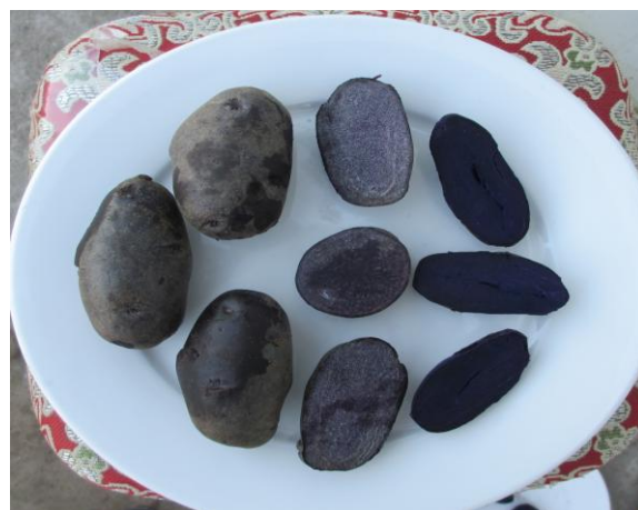
多彩马铃薯：黑紫薯